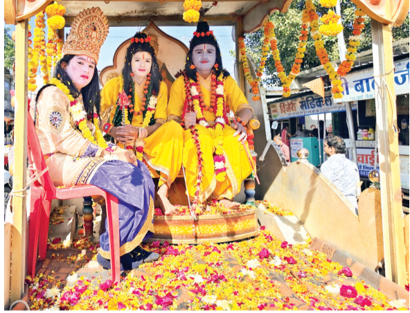
हरिभूमि न्यूज ▶▶ जीरापुर

समग्र हिन्दू समाज को जाग्रत करने के उद्देश्य से हिन्दू सम्मेलन का आगाज अक्षत कलश, शोभा यात्रा एवं नवीन हाट बाजार तालाब परिसर में भूमि पूजन से हुआ। आगामी 11 जनवरी को होने वाले विराट हिन्दू सम्मेलन को लेकर नगर में शोभा, कलश यात्रा एवं भूमि पूजन का आयोजन हुआ। यात्रा में पुरुषों के साथ बड़ी संख्या में महिलाओं शामिल हुए। महिलाएं अपने सिर पर कलश धारण किए यात्रा को सुशोभित कर