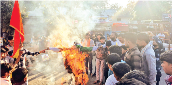
हरिभूमि न्यूज | कानड़

बांग्लादेश में हिंदुओं पर हो रहे अत्याचार के खिलाफ बजरंग दल एवं विश्व हिंदू परिषद के आह्वान पर कानड़ नगर में विरोध प्रदर्शन कर पुतला दहन किया गया। कार्यकर्ताओं ने कहा कि यहाँ केवल एक व्यक्ति की हत्या नहीं