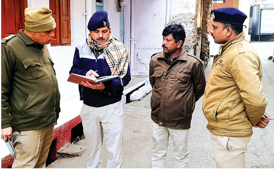
हरिभूमि न्यूज ▶▶ राजगढ़

खास बातें ■ जिस व्यापारी के यहां चोरी हुई घटना के कुछ समय बाद अटके से उनका निधन ■ पुलिस अधीक्षक, क्षेत्रीय विधायक सहित अन्य अधिकारियों ने किया मोका-मुआयना