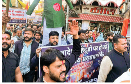
हरिभूमि न्यूज ▶▶ सारंगपुर